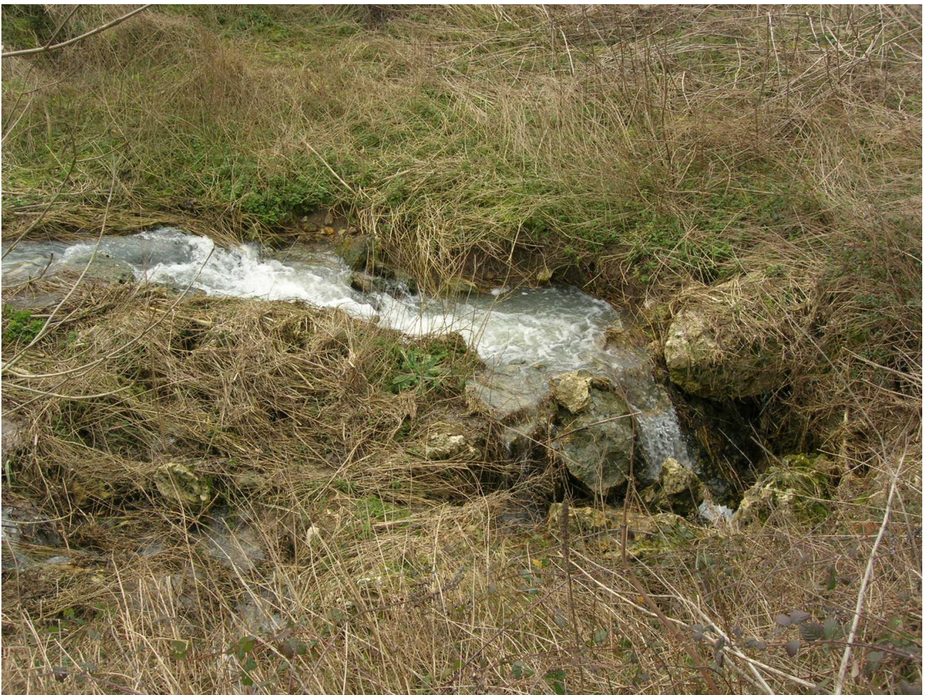
Le gouffre du Traveteau absorbe la totalité du débit du ru du Châtelet

L'imaginaire collectif représente généralement une nappe d'eau souterraine comme un ensemble de grottes et de lacs souterrains, reliés par des veines ou des boyaux . Qui n'a pas vu à la télé, ou visité, une grotte aux salles gigantesques, traversées par une rivière souterraine? Cette caractéristique des aquifères karstifiés correspond bien aux aquifères des Alpes et du midi de la France. Mais pour la nappe des calcaires de Champigny, il faut plutôt imaginer une... éponge imbibée et lentement traversée par l'eau. En surface, on trouve des gouffres , de petites tailles, dans lesquels les eaux de surface s'infiltrent et rejoignent rapidement la nappe. Cet aquifère-éponge est parcouru de quelques fractures progressivement élargies par la dissolution des calcaires, dans lesquelles l'eau s'écoule plus rapidement. On dit que c'est un milieu à double porosité : la porosité de l'éponge, dans laquelle l'eau s'écoule lentement et la porosité des fissures, où l'eau peut circuler très vite. Ces deux modes de circulation jouent un rôle important dans la propagation d'une pollution. Les gouffres et les réseaux de fractures restent ici de petites tailles, et ne sont pas pénétrables par l'homme. Ils jouent néanmoins un rôle important de mise en relation des eaux de surface et des eaux souterraines.